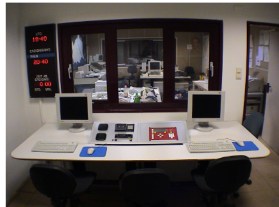
Die Steuerzentrale Control Centre